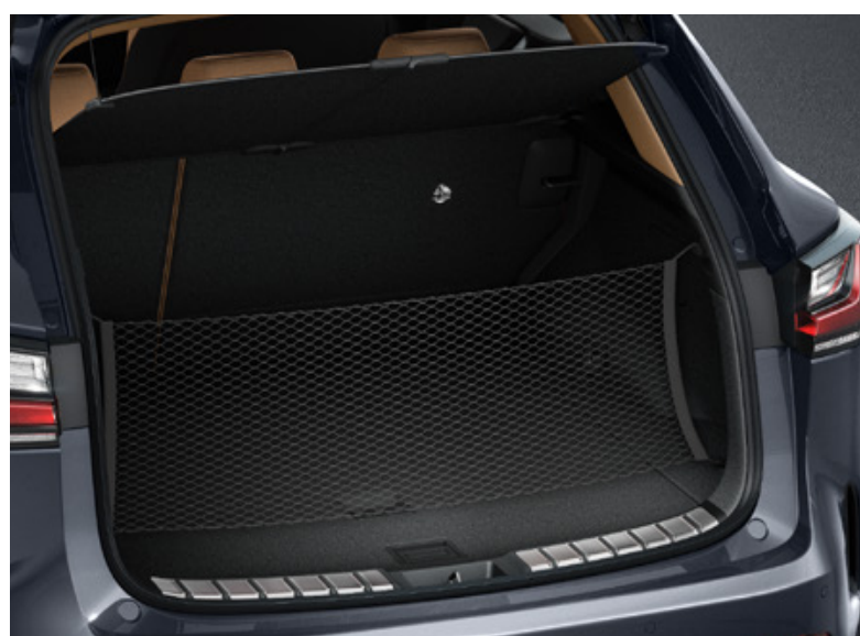
Сітка для багажника вертикальна