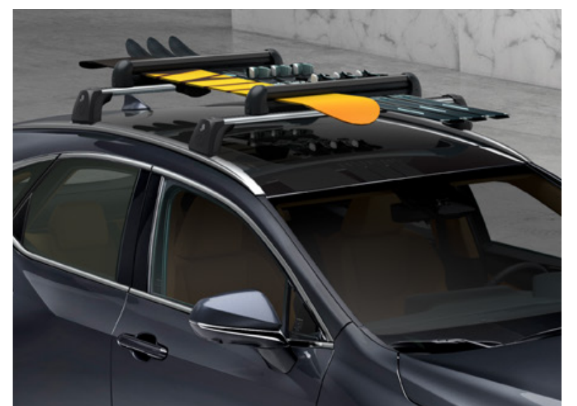
Поперечини даху та кріплення для лиж та сноуборду