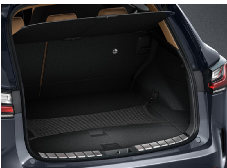
Сітка для багажника горизонтальна