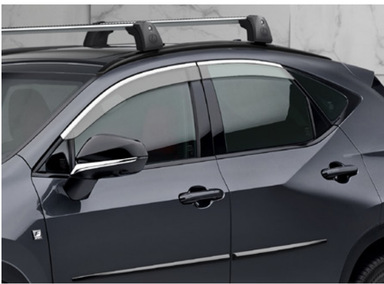
Дефлектори вікон з хромованим окантуванням