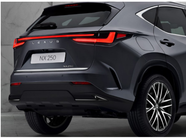
Декоративна накладка дверей багажника