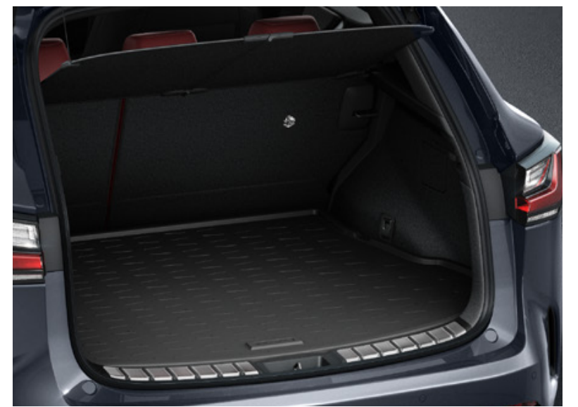
Гумовий піддон багажника