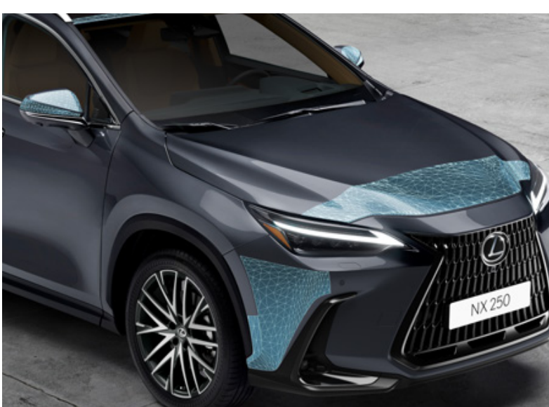
Комплект захисних плівок кузова