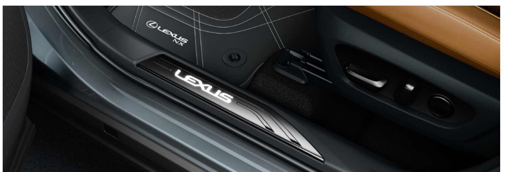
Накладки порогів з підсвіткою