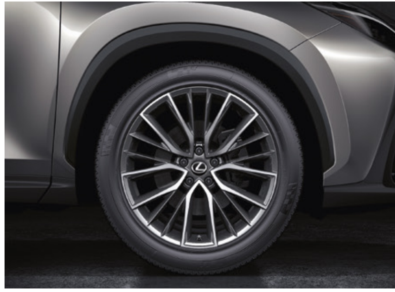
Дизайн 2 (Luxury)