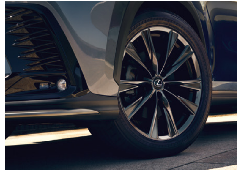
Дизайн F Sport