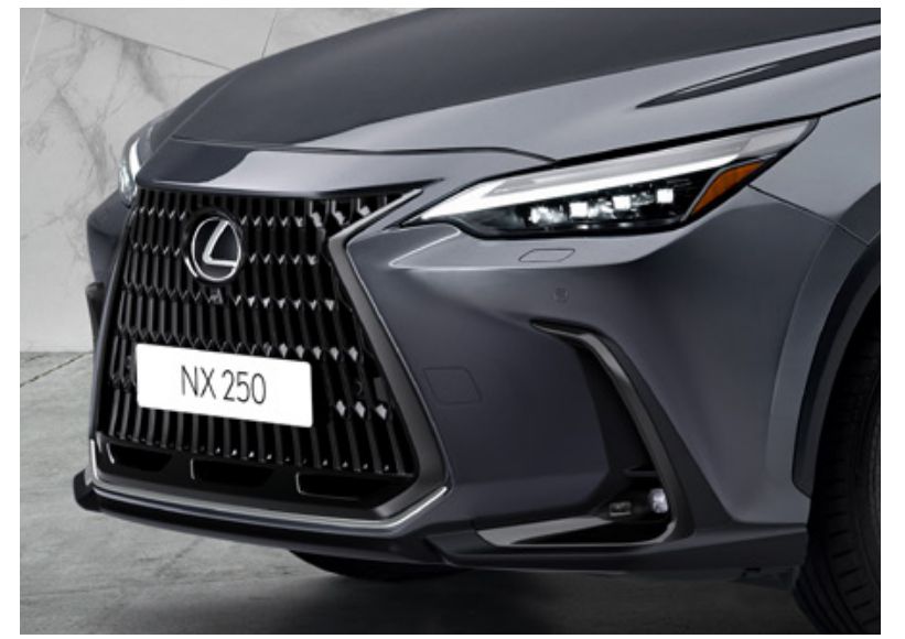
декоративна накладка переднього бамперу